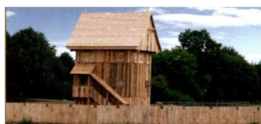
Nachbau einer Burganlage – Castrum Vechtense

Wir werden uns im Rahmen einer Führung mit dem Thema Ritter und Burgen auseinandersetzen.